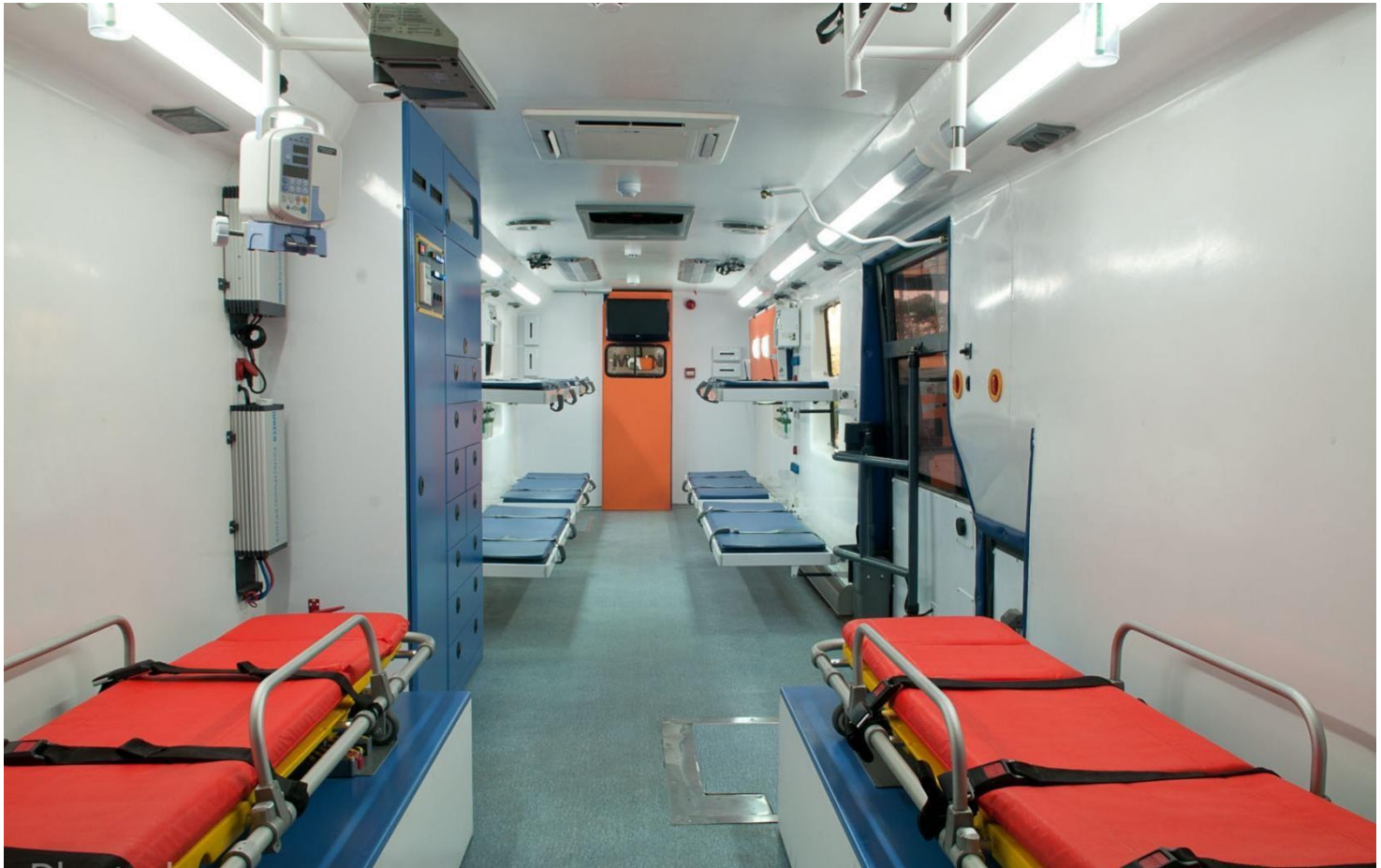
تجهیز ۱۰ تختخواب تاشو جهت انجام خدمات اضطراری پزشکی